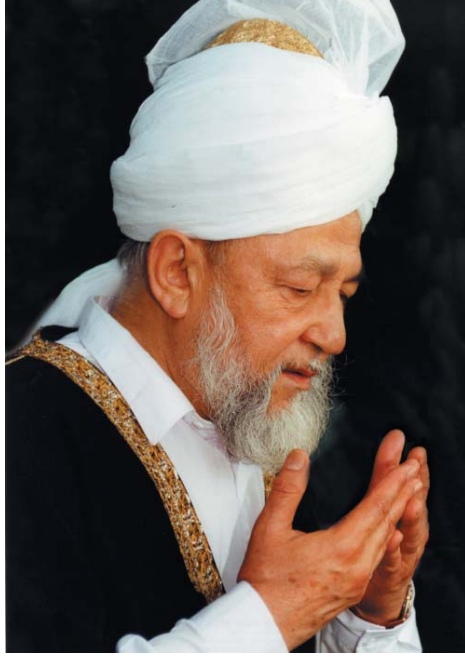
حضرة مرزا طاهر أحمد (رحمه الله)

حب العرب من الإيمان. (المستدرك للحاكم، كتاب معرفة الصحابة رضي الله عنهم)